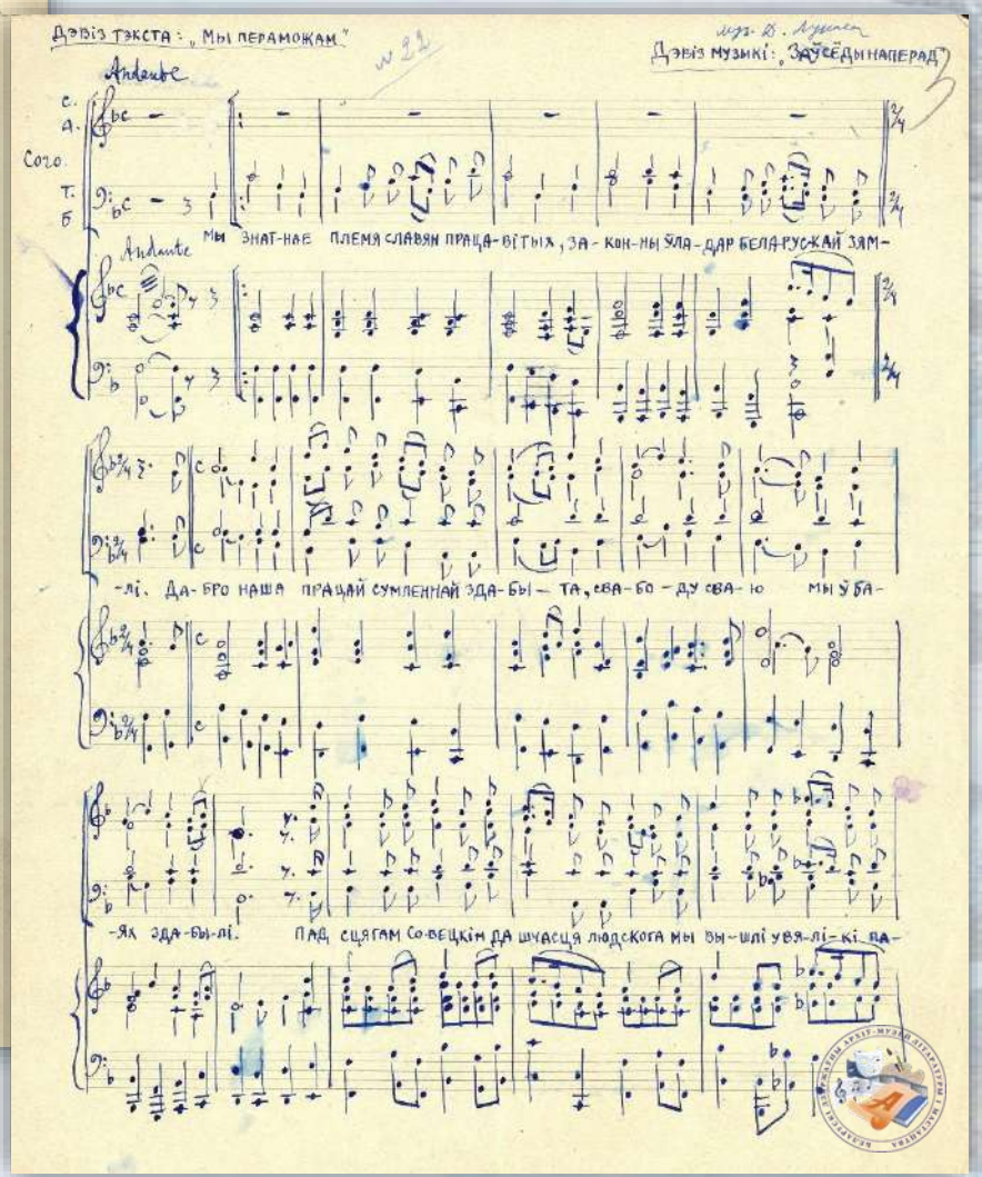
Варыянты гімнаў для 6-ці і 4-х галаснога змешанага хору з ф-п, напісанья на конкурс беларускага гімна. Аўтограф, рукапіс. 2 мая 1944 г. Ф. 139. Воп. 1. Спр. 74. Арк. 1-3.