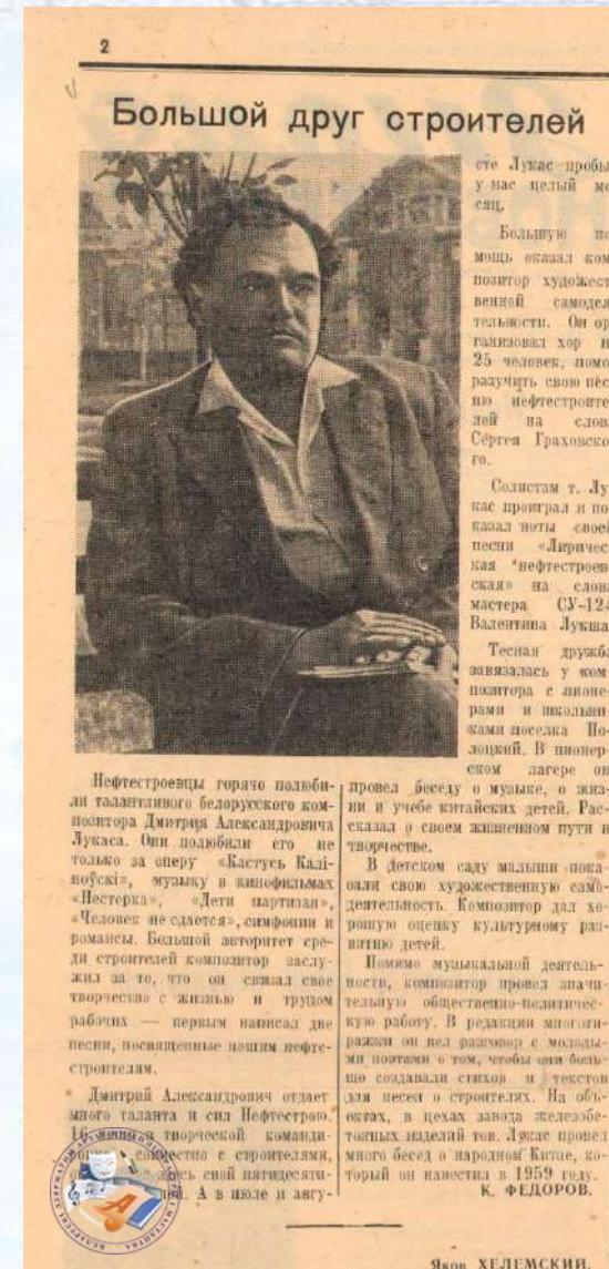
Газета «Знамя новостройки». 18 жніўня 1961 г. Ф. 139. Воп. 1. Спр. 204. Арк. 1.