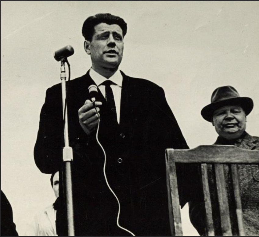
Выступленне на кніжным кірмашы, 1963. Ф. 37, в.1, с. 484, арк.118.