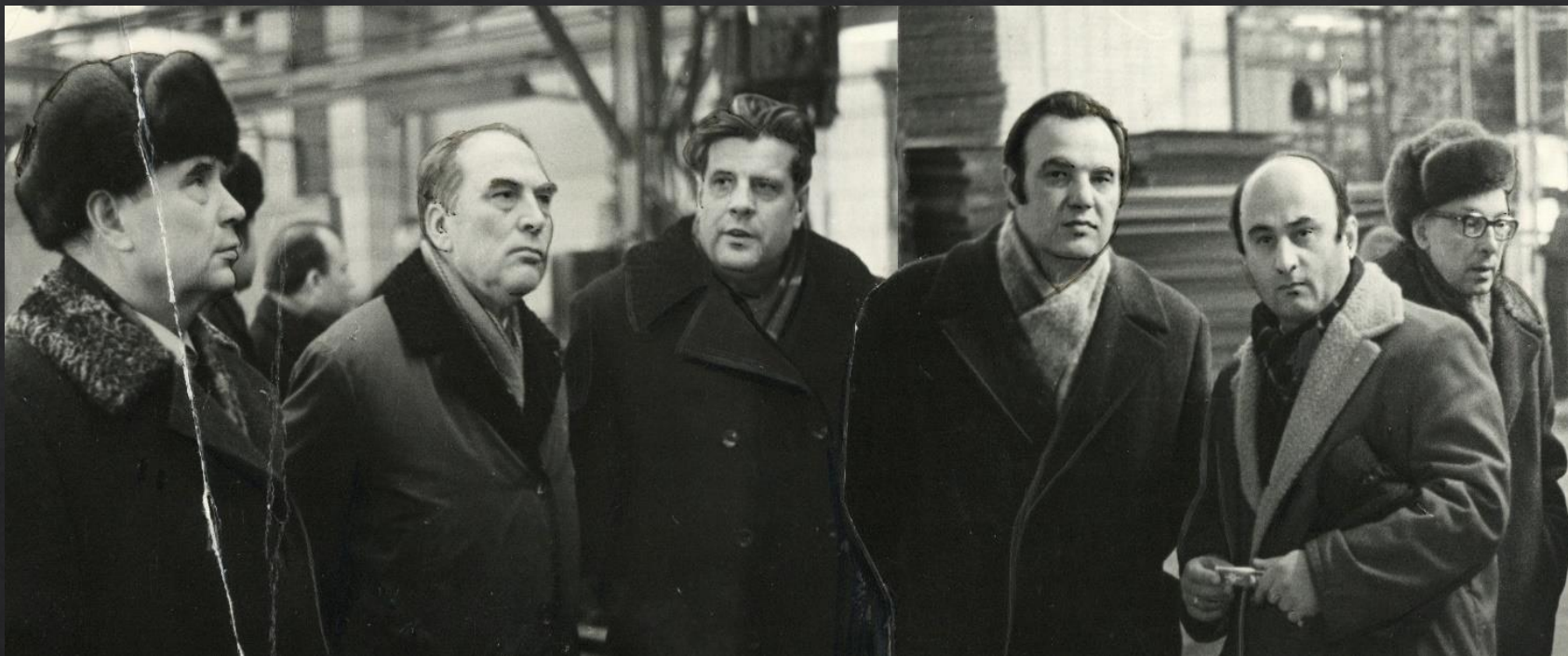
З калегамі на Мінскім заводзе халадзільнікаў, кастычнік 1971. Ф. 281, в.1, с. 317, арк. 2.